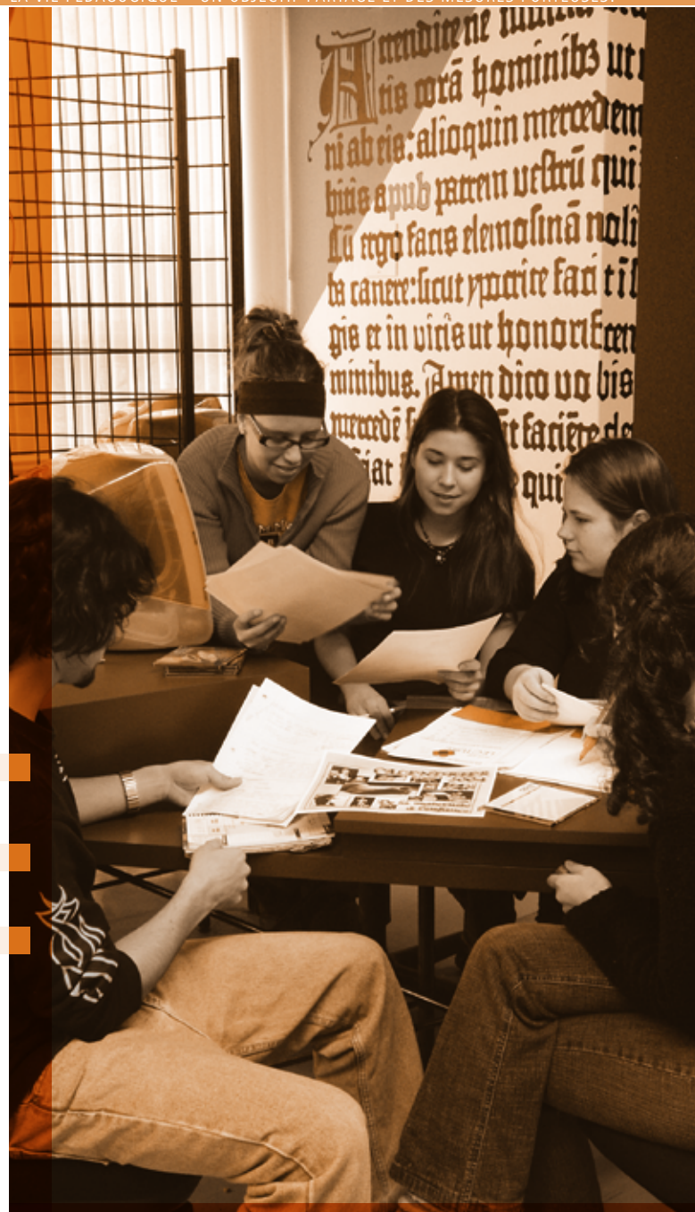
Réussite à l'épreuve uniforme de français