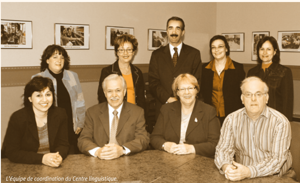
L'équipe de coordination du Centre linguistique.

Finalement, le cahier d'exercices « L'Atout pour communiquer » de niveau intermédiaire est terminé et disponible dans différents points de vente. S'ajoute à cela, la méthode d'enseignement « L'Atout pour communiquer » qui a été complétée et expérimentée au printemps 2006.