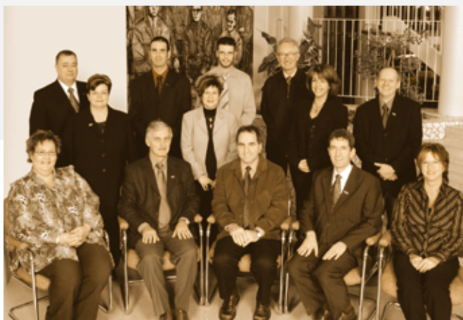
Le conseil d'administration 2005-2006 du Cégep de Jonquière. Le Collège possède et applique un code d'éthique et de déontologie pour ses administrateurs.

Événement à souligner également, afin de stimuler davantage l'effervescence et la créativité du personnel et des élèves, les membres de la Fondation Asselin du Cégep de Jonquière ont procédé à un premier appel d'offres de projets dans trois des quatre secteurs ciblés lors de la campagne de financement. Ainsi, neuf projets nécessitant une aide financière de près de 200 000 $ ont été mis en œuvre tant en recherche qu'en lien avec les technologies de l'information ou encore sur le plan des échanges internationaux.