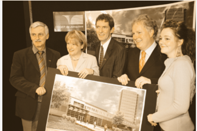
Conférence de presse officialisant la participation du gouvernement du Québec aux travaux d'agrandissement du pavillon Joseph-Angers.

Enfin, le Cégep a su encore cette année se démarquer par divers événements et reconnaissances de son personnel, en lien avec des expertises particulières comme la recherche sociale et ses techniques physiques et humaines.