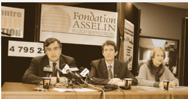
Conférence de presse du dévoilement des résultats de la campagne de financement de la Fondation Asselin du Cégep de Jonquière.