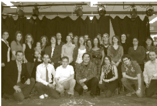
Ton avenir en Charlevoix

d'un centre d'aide en Sciences humaines, l'accompagnement des élèves en méthodes quantitatives et la révision des plans-cadres en Soins infirmiers ont été parmi les projets priorités.