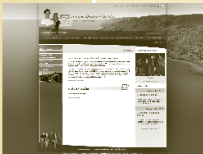
Portail du nouveau site Web du Centre d'études collégiales en Charlevoix