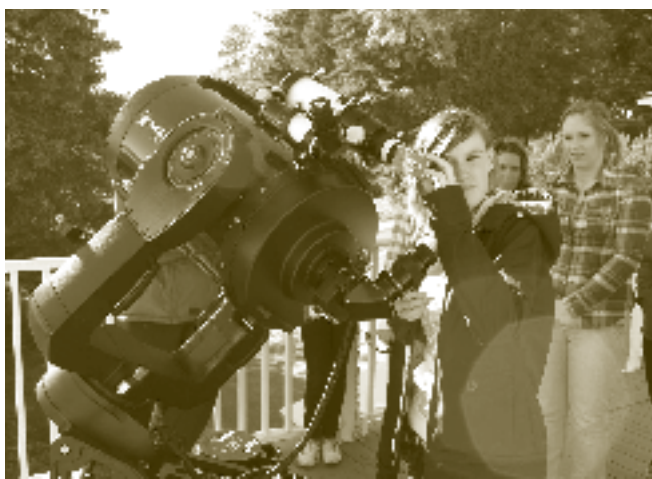
Étudiante en Sciences humaines observant le Soleil en direct.

Les programmes de réinvestissement dans le cadre des transferts fédéraux et les subventions pour soutenir la recherche accordées par la Fondation Asselin du Cégep de Jonquière ont permis aux équipes enseignantes de s'investir dans des projets d'amélioration de leur pratique professionnelle. La pédagogie de la première session en Sciences de la nature, la restructuration des centres d'aide, l'ouverture