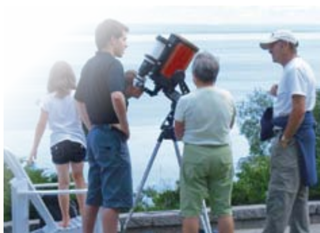
Observatoire astronomique de Charlevoix.