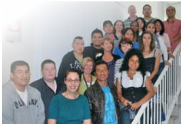
Accueil d'étudiants au Centre linguistique.