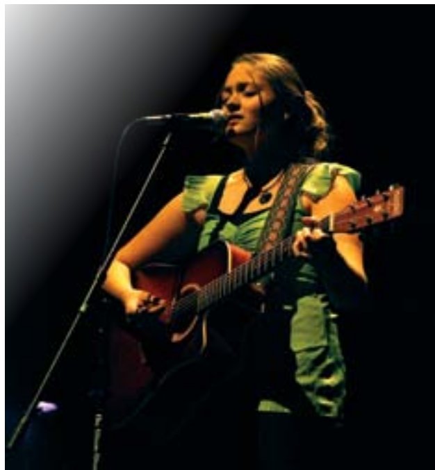
Cégeps en spectacle.