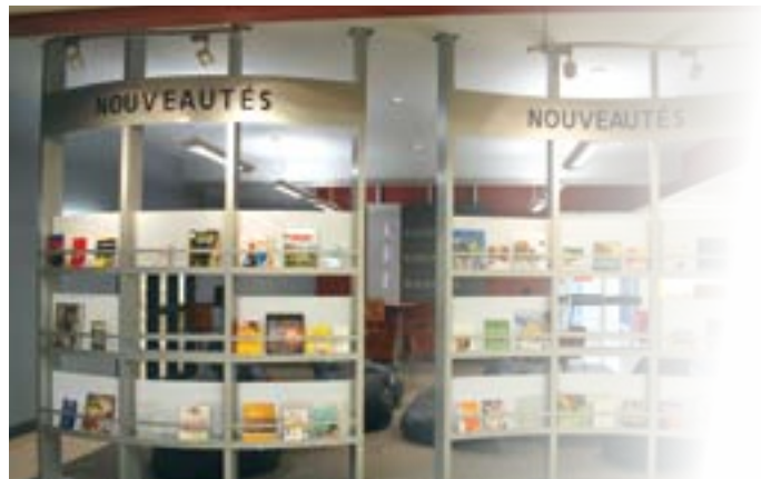
Le Centre des ressources éducatives.

Assurer la qualité, la disponibilité et l'accessibilité des infrastructures