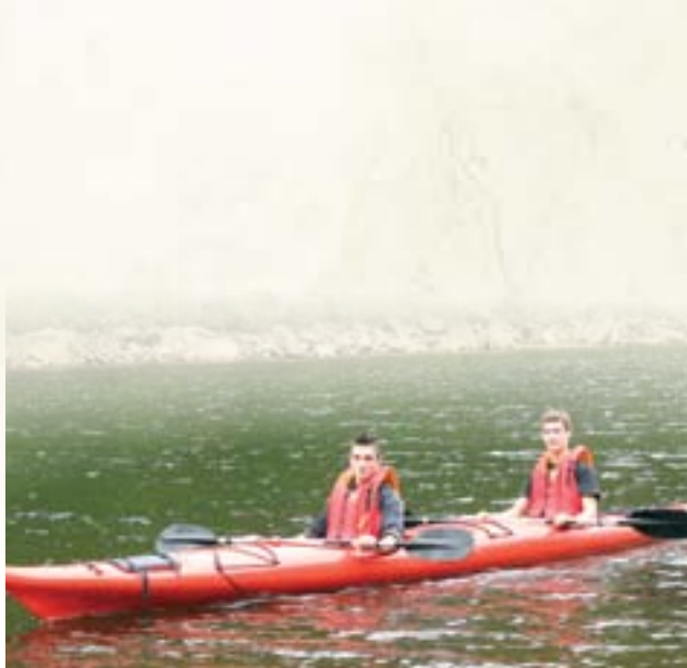
Activité d'Accueil au CECC.