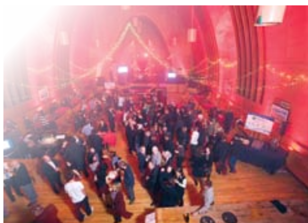
Soirée gala du 15 e anniversaire du CECC.