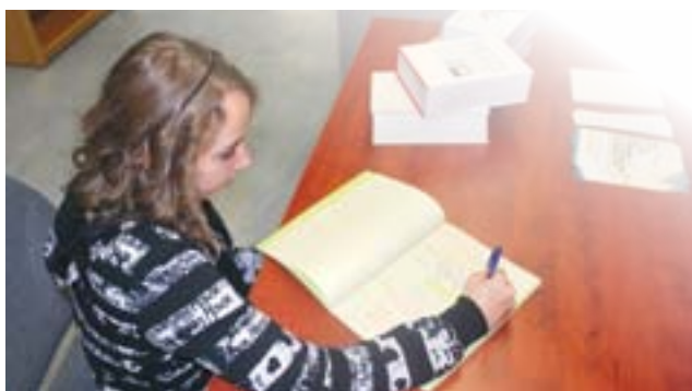
Le Centre d'aide en français Le Participe.

travaux. Le pourcentage d'amélioration de la réussite en français est passé de 72 % à 82 %. Une aide a été apportée à la préparation de l'épreuve uniforme de français (EUF) à 43 élèves ayant déjà échoué à cette épreuve. De ce nombre, 22 personnes ont de nouveau échoué à ladite épreuve. De plus, 259 élèves ont participé au tutorat par les pairs. En écriture, les résultats se sont améliorés de 50 % après une session de fréquentation. Le taux de réussite