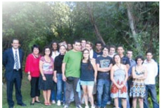
Accueil d'étudiants internationaux.