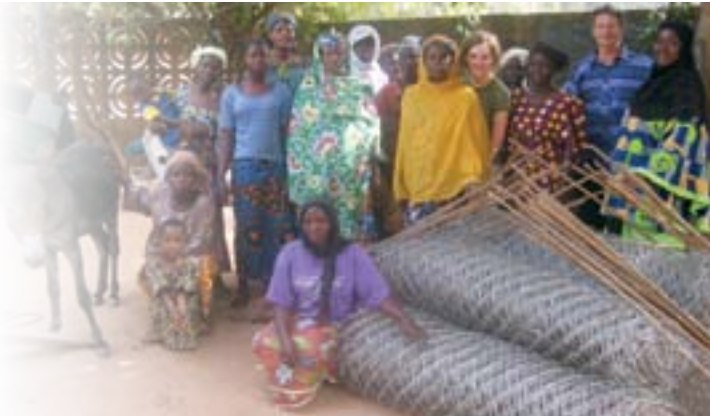
Un groupe d'étudiants en stage au Burkina Faso.